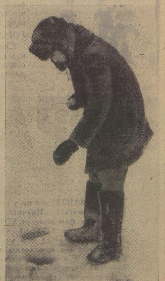
«Ловись, ловись, рыбка большая и маленькая!»

Такие занимательные рассказы о животных постоянно печатаются в журнале «Юный натуралист».